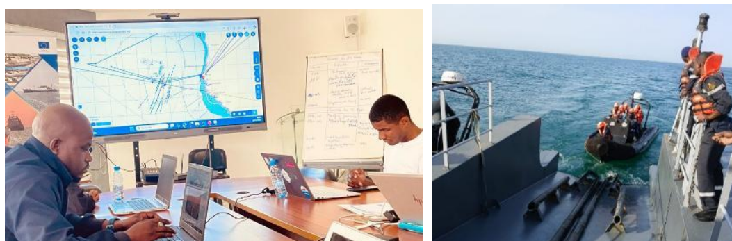
Une vue d'experts impliqués dans le contrôle de la patrouille de l'Opération ESPADON

Les procédures engagées à la suite de ces infractions ont été transmises aux autorités nationales compétentes afin d'assurer le traitement administratif et judiciaire conformément aux législations nationales en vigueur.