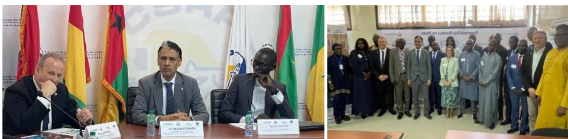
Cérémonie d'ouverture et photo de famille des magistrats durant la formation

Cette session visait à renforcer la compréhension du cadre juridique applicable à la lutte contre la pêche INN et à améliorer le traitement judiciaire des infractions constatées en mer. Elle a été organisée au profit du Sénégal en tant que pays hôte du Poste Sous-Régional de Coordination des Opérations (PSRSCO) dans le cadre de l'opération ESPADON.