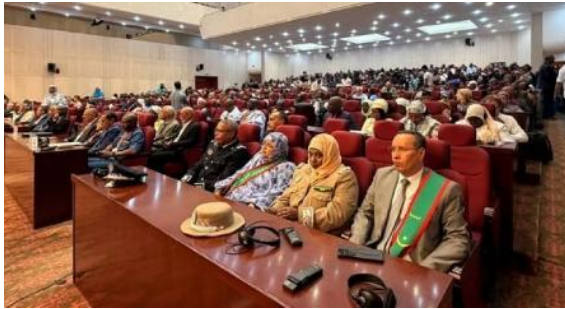
Cérémonie d'ouverture du FOMACO

Du 27-30 avril 2026 s'est tenu le Forum Régional Marin et Côtier (FOMACO) organisé par le Partenariat Régional pour la Conservation de la zone Côtière et Marine en Afrique de l'Ouest (PRCM), à Nouakchott, Mauritanie.