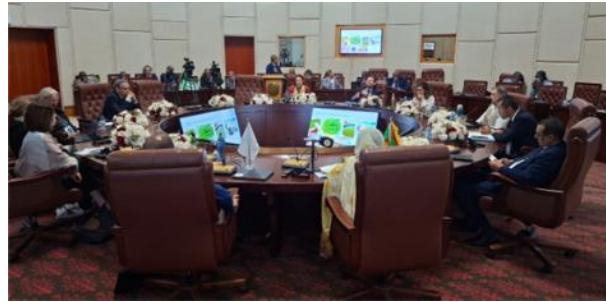
Table ronde des bailleurs pour la Stratégie bleue de la Mauritanie

Le PRCM, aux côtés de l'UICN (et en collaboration avec l'UEMOA, le RAMPAO, BlueSeeds et Eclasio) est partenaire pour la mise en œuvre du pilier 3 de WASOP, portant sur la préservation des écosystèmes marins et côtiers en Afrique de l'Ouest. C'est pourquoi la participation de WASOP à cet événement est stratégique pour fédérer les acteurs et co-construire des solutions durables pour la gestion des ressources, le développement d'une économie bleue durable et la préservation des écosystèmes marins et côtiers en Afrique de l'Ouest.