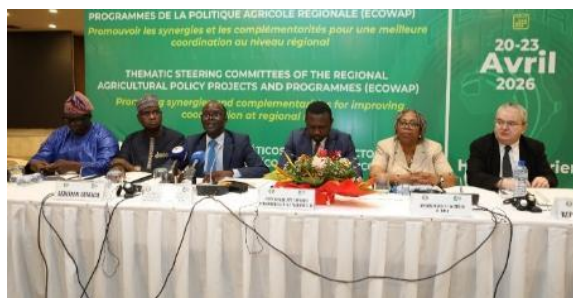
Ouverture des travaux des Comités de pilotage

Le WASOP a accordé le mardi 21 avril 2026 une attention particulière à la Thématique : “Développement de l'élevage, du pastoralisme, de la pêche et de l'aquaculture” . Qui a mis en lumière les priorités régionales relatives à la gestion durable des ressources, aux chaînes de valeur, à la résilience des communautés et à la gouvernance sectorielle.