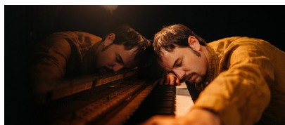
Daniel Garcia trio (Espagne)

Surnommé le magicien du oud, Driss El Mouloumi est né en 1970 à Agadir. Il est probablement l'un des oudistes les plus recherchés de sa génération. Après une licence en littérature arabe, il rédige un mémoire sur l'approche philosophique de la musique. En parallèle, il suit une solide formation en musique classique arabe et occidentale, et obtient successivement les premiers prix de oud et le prix d'honneur de l'Académie nationale de musique et le prix d'honneur à l'examen national de oud au Conservatoire national de musique de Rabat en 1992. Depuis 2010, il est directeur du Conservatoire de musique d'Agadir. Ses travaux se nourrissent de la rencontre avec des artistes internationaux, tels que Jordi Savall & l'ensemble Hesperion XXI (Espagne), et Montserrat Figueras, avec qui il a collaboré à plusieurs albums ainsi que Pierre Hamon (France), Keyvan Chemirani (Iran), Omar Bachir (Iraq), Carlo Rizzo (Italie), Claude Tchamitchian (Arménie) et bien d'autres.