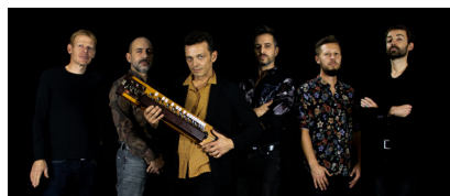
JEMM Music Project (Italie)