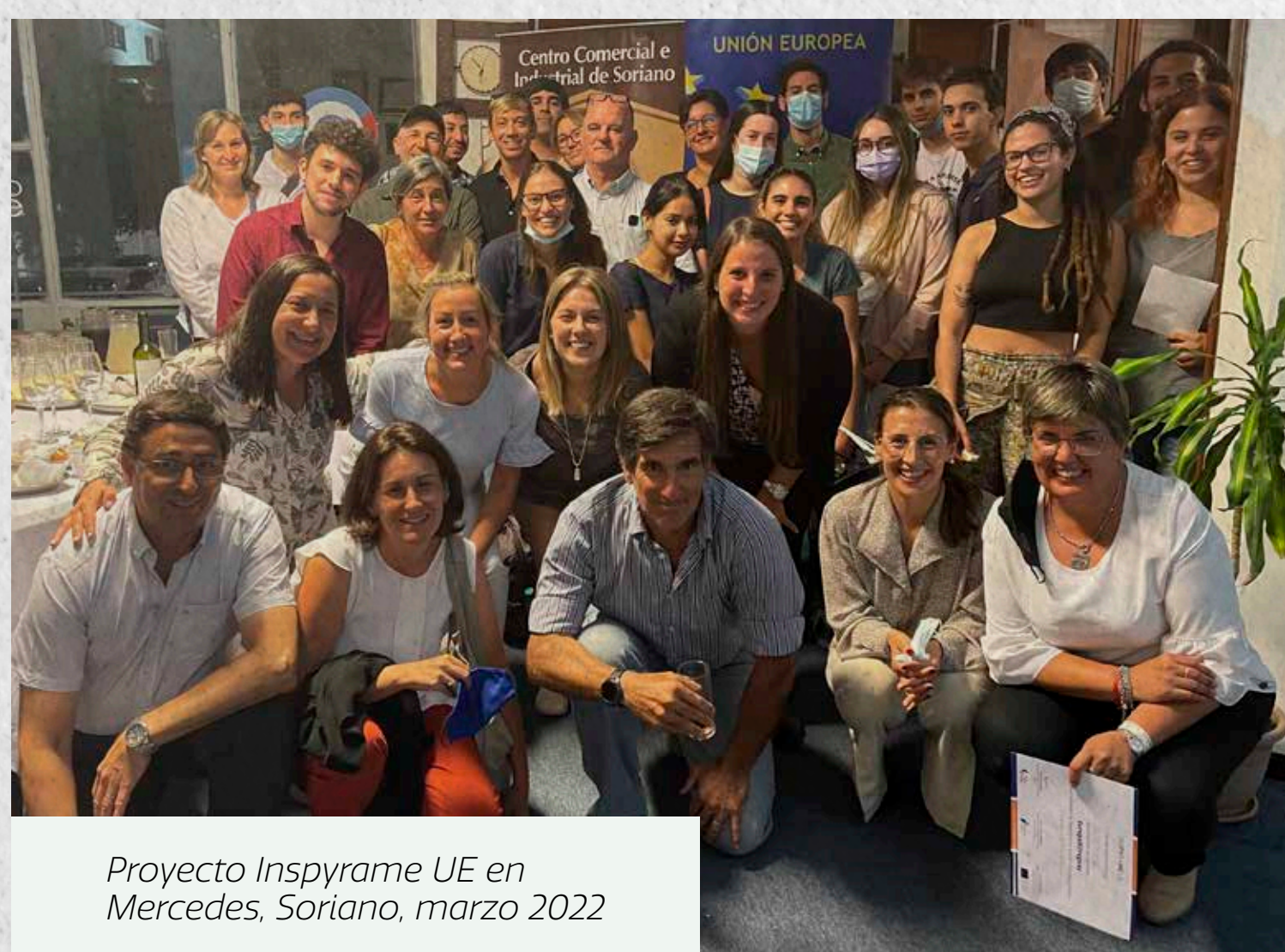
Proyecto Inspyrame UE en Mercedes, Soriano, marzo 2022

InsPYraME UE es implementado desde 2020 por la Cámara de Comercio y Servicios del Uruguay y la Eurocámara Uruguay y cuenta con co-financiación de la Unión Europea.