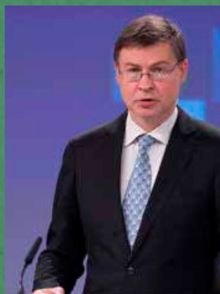
Valdis Dombrovskis, Vicepresidente Ejecutivo y Comisario de Comercio de la UE

Declaró que con el objetivo de mejorar la política comercial, se está revisando la necesidad de recalibrar el enfoque de la sostenibilidad en los acuerdos de comercio e inversión. Agregó que diversos estudios han demostrado que las políticas comerciales de desarrollo sostenible son dinámicas y de rápido desarrollo, debiendo adaptarse a contextos específicos. “Ahora estamos preparados para llevar esto adelante y hacer que la política comercial sea mejor, más fuerte y más sostenible”.