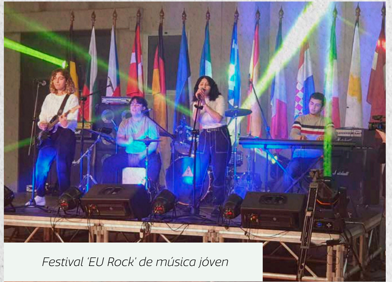
Festival 'EU Rock' de música joven

Según un informe realizado por la UE sobre la Juventud, ésta generación de jóvenes es la mejor formada de la historia y está especialmente capacitada para utilizar las tecnologías de la información y la comunicación, y las redes sociales. La UE apuesta al liderazgo de los jóvenes, a desarrollar su potencial. Se necesitan jóvenes empoderados en todos los ámbitos: como científicos, como activistas sociales, como actores políticos, como empresarios, como innovadores.