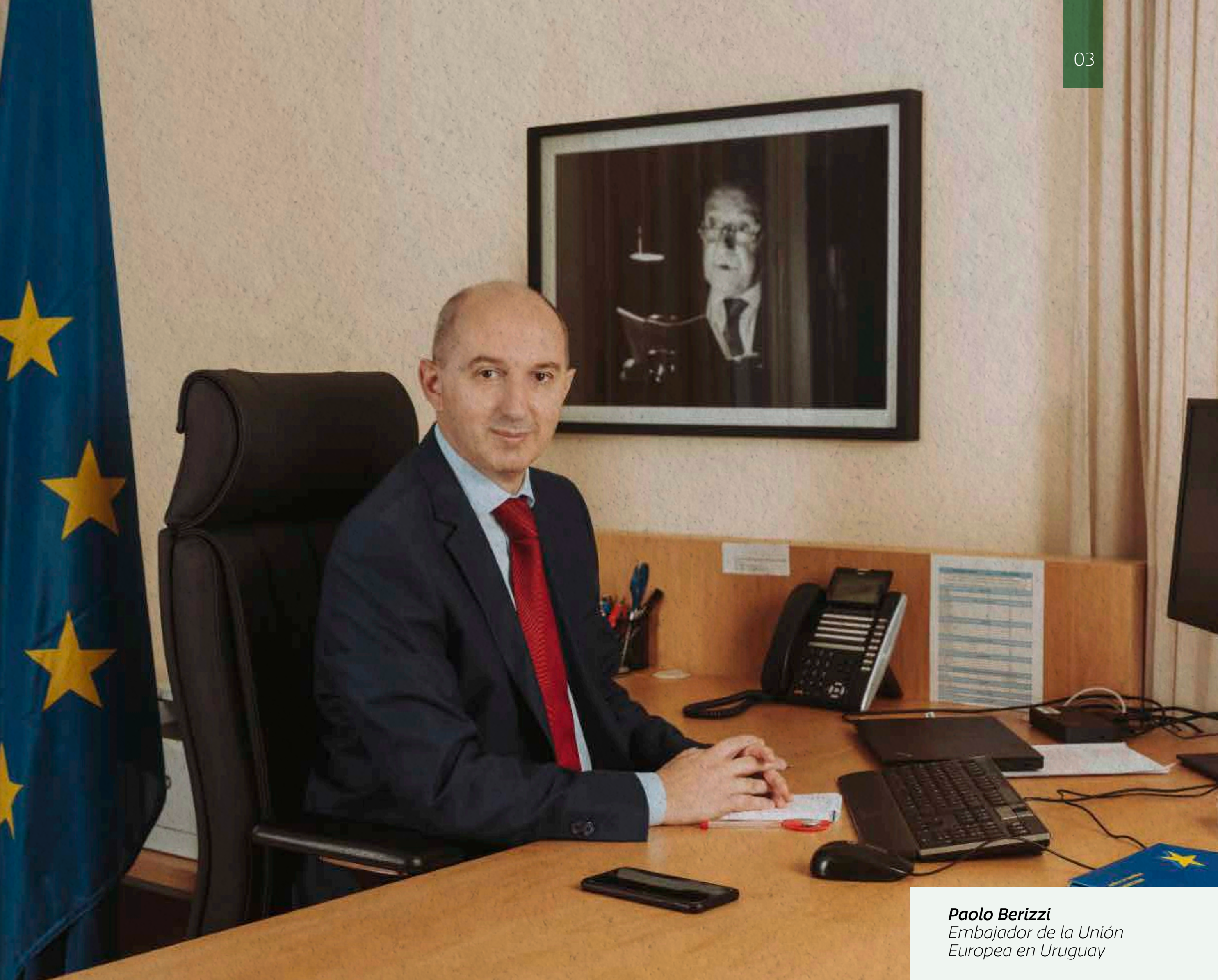
Paolo Berizzi Embajador de la Unión Europea en Uruguay

C ada 9 de mayo la Unión Europea celebra el Día de Europa, conmemorando un nuevo aniversario de la histórica 'Declaración Schuman', que expuso una nueva forma de cooperación política entre los países europeos, basada en un principio muy sencillo: la paz mundial no puede preservarse sin un esfuerzo equiparable al peligro que la amenaza.