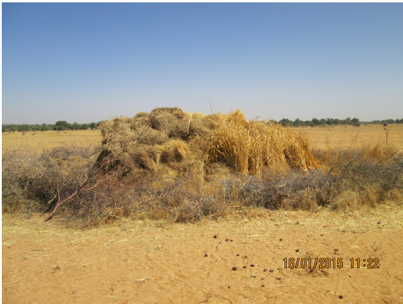
Photo 4 : Conservation des résidus de récolte, pour l'alimentation du bétail. Ici à Amballé.