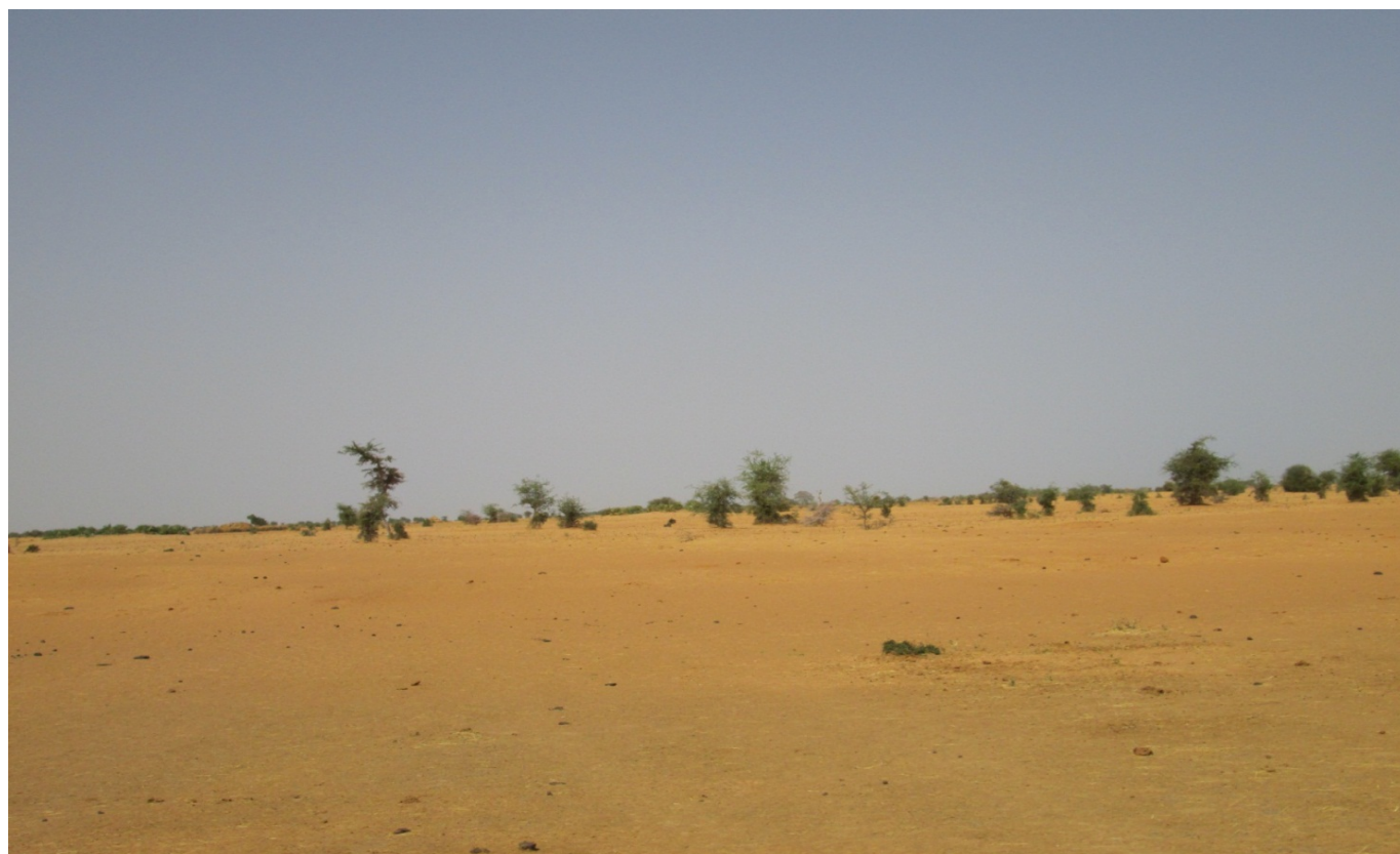
Photo 1 : Les sols sablonneux ou « goz ». Leur forte perméabilité permet aux animaux de se camper en saison pluvieuse. Ici entre Ambadaye et Angatati.

Trois types de sols sont présents dans la zone. Elle est tout d'abord dominée par des sols steppique, observable dans les plaines. Elles sont favorables aux cultures de mil mais aussi aux pâturages. Certains terrains sont constitués des sols subarides avec des formations sablonneuse appelé « goz ». La forte perméabilité permet aux bétails de se camper pendant les saisons pluvieuses. On distingue parfois des sols hydromorphes, dans les bas-fonds. Leur faible perméabilité autorise la culture de contre saisons. L'intensification des cultures dans les sols subarides et steppiques fait que le rendement décroît d'année en année. Mais, comme la communauté dispose des bétails, ces derniers sont conduits vers les sols pauvres. Leurs bouses serviront à augmenter le rendement. A noter aussi que le sol de la zone se dégrade progressivement du fait de l'érosion.