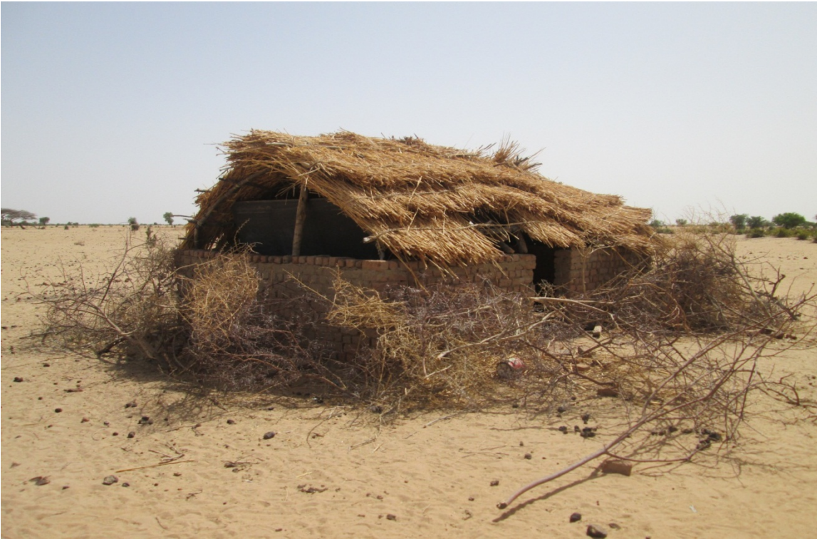
Photo 9: L'unique salle de classe à Angatati, qui reste fermer faute d'enseignant.