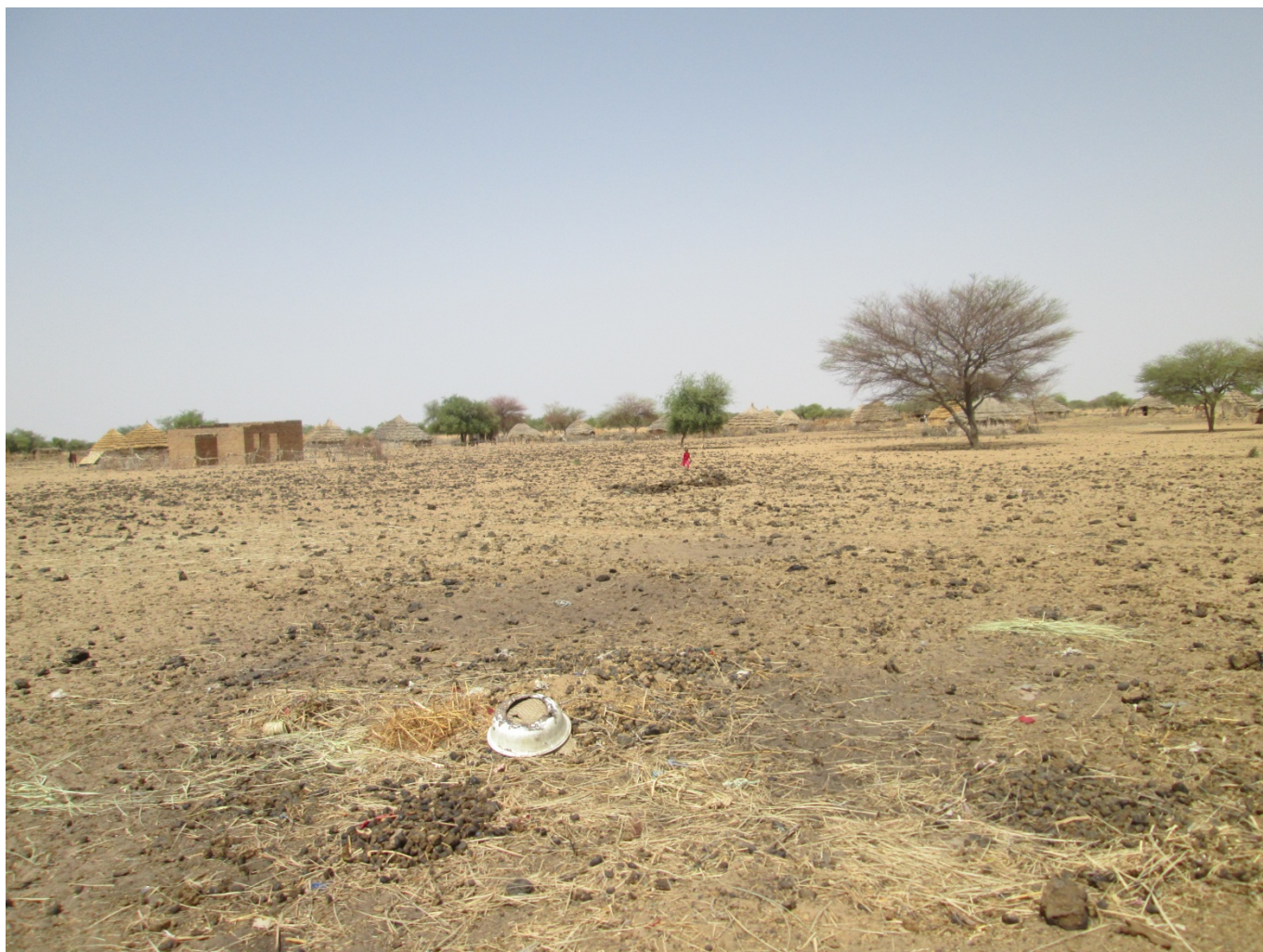
Photo 5: Lieu de parcage des animaux qui deviendra un champ de culture en saison de pluie. Ici à Angatati.