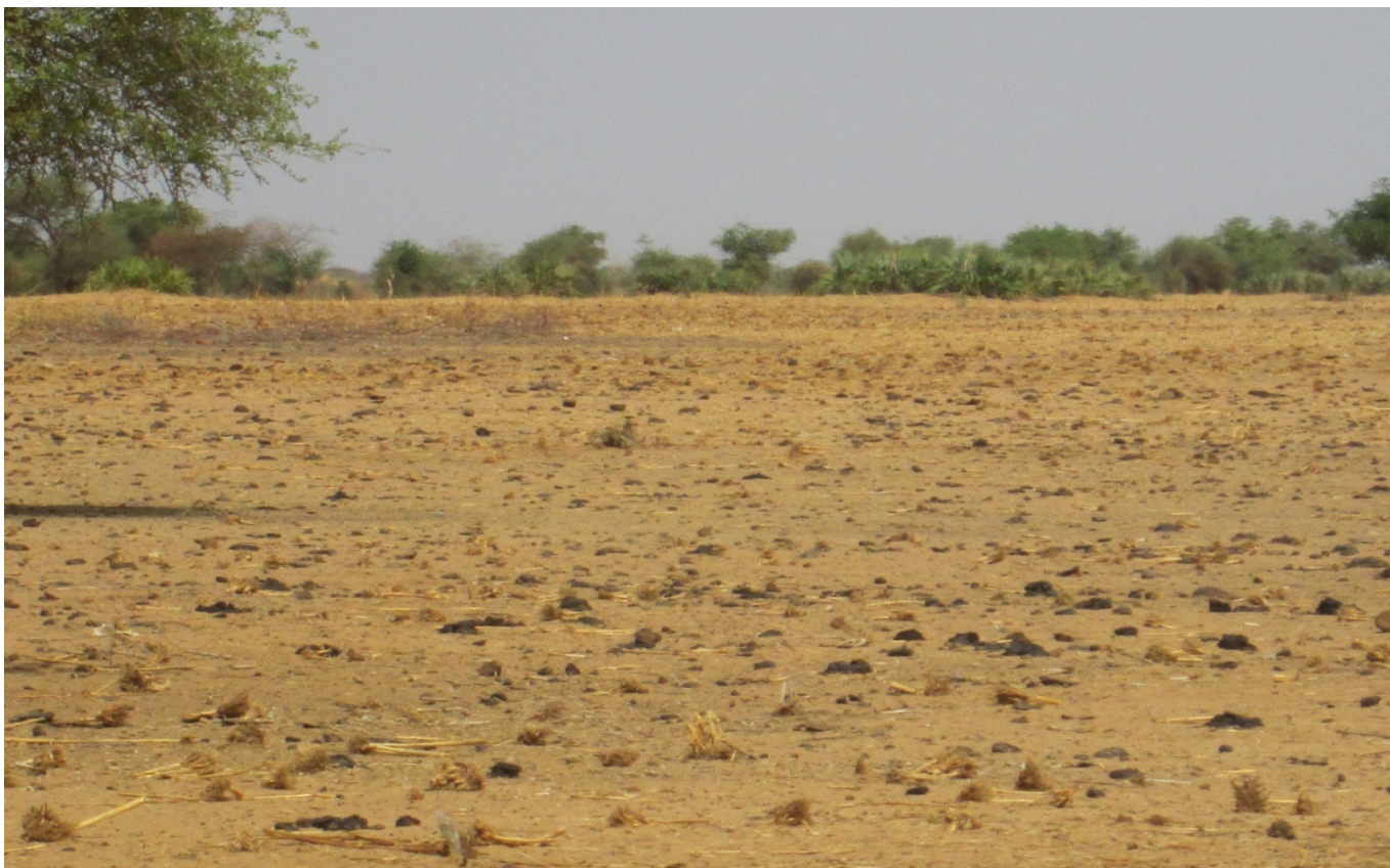
Photo 7 : Champ de mil, après la récolte et le passage des animaux pour le pâturage. Ici à Walade Sallam.