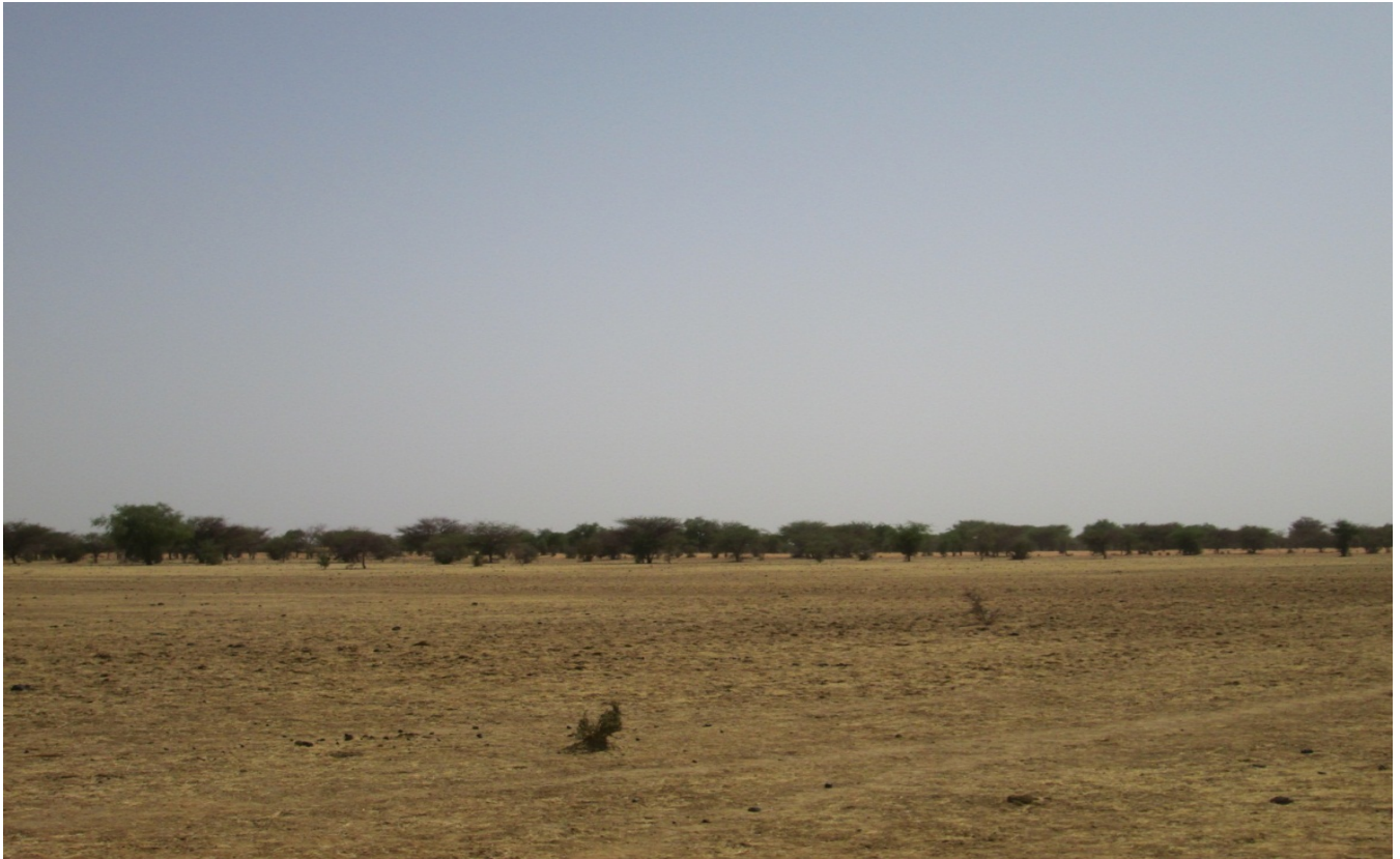
Photo 2 : Les bas-fonds, favorables aux cultures de contre-saison. Ici près d'Amgarada