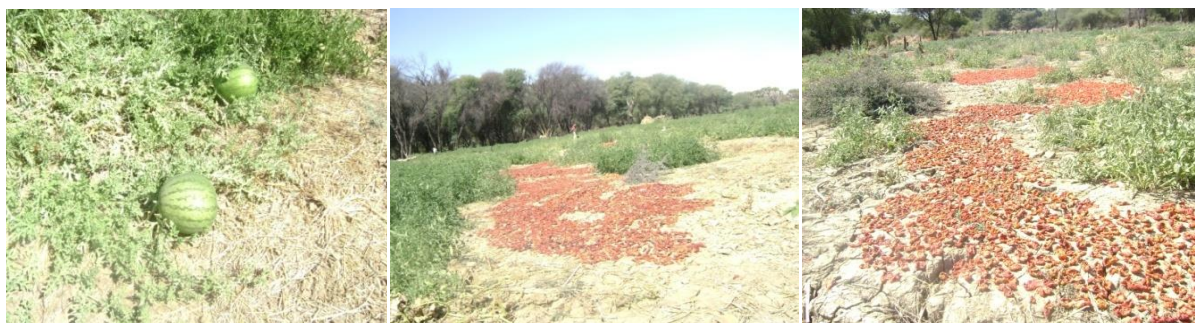
Photos 3 : Cultures maraîchères au bord du fleuve Batha, près de Dankoutch