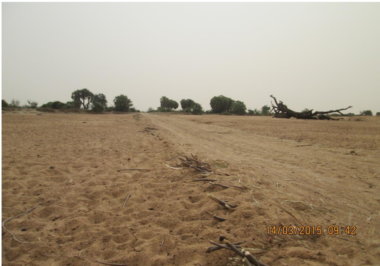
Photo 4 : Piste rurale aménagée avec les bois dans le lit du Batha sur l'axe Maksaba-Arba(Seita)