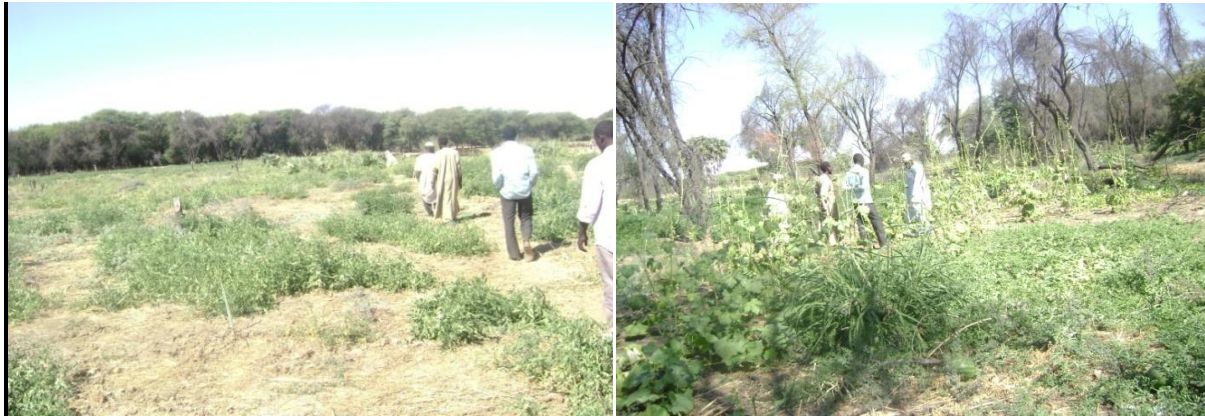
Tableau 2 : Atouts, faiblesses, opportunités et menaces du domaine agriculture