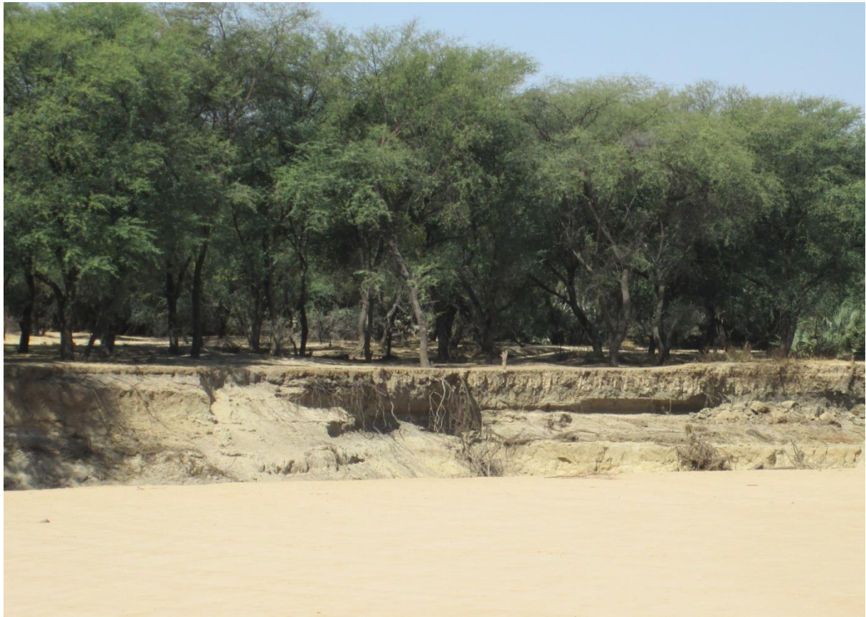
Photo 1 : Le lit du fleuve Batha. On remarque ici l'apparition des racines des arbres due à l'érosion hydrique.

La présence du Batha et son affluent fait que la zone s'isole totalement pendant la saison pluvieuse.