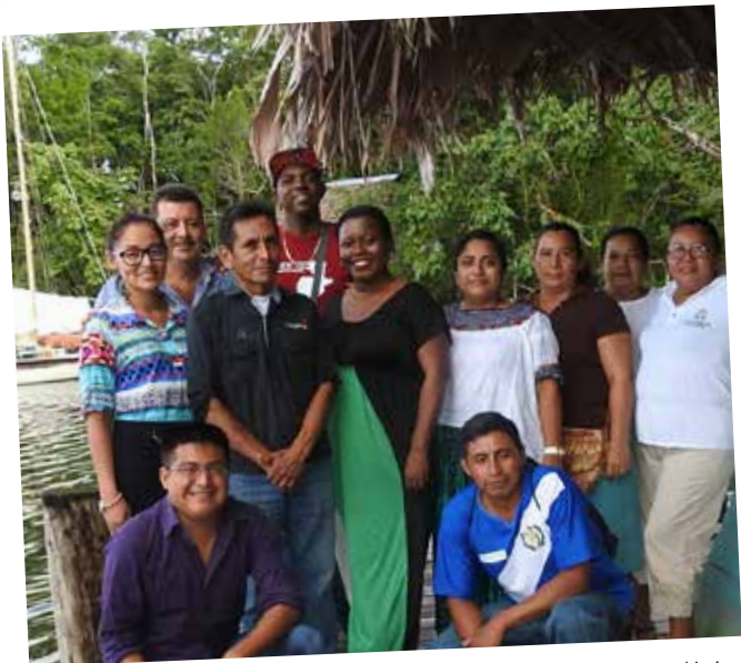
Participantes de la red de turismo comunitario del Corredor Biológico Binacional.