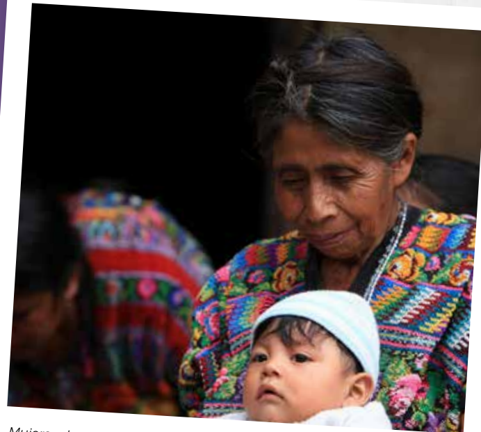
Mujeres de Momostenango, municipio donde se ubica el sitio piloto de PINN.

La Plataforma de Información Nacional sobre Nutrición es una iniciativa global de la Unión Europea y se ejecuta en 10 países alrededor del mundo, siendo Guatemala el único país de Latinoamérica. Es implementado por CATIE (Centro Agronómico Tropical de Investigación y Enseñanza) y como beneficiario directo la Secretaría de la Seguridad Alimentaria y Nutricional (SESAN). Se inició en agosto de 2017.