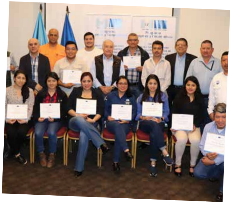
Técnicos de la Dirección de Sanidad Vegetal del MAGA, participantes del taller "Actualización de Normas Internacionales para Medidas Fitosanitarias NIME."

Mejorar la competitividad de las MIPYMES y Cooperativas para cumplir con los requisitos del mercado, es el objetivo de este programa. Y para cumplirlo, está fortaleciendo las capacidades instaladas de las instituciones que les prestan servicios a las MIPYMES y Cooperativas, como el Ministerio de Agricultura, Ganadería y Alimentación (MAGA), Ministerio de Salud Pública y Asistencia Social (MSPAS) y el Instituto Nacional de Cooperativas (INACOP). Este fortalecimiento se ha dado a través de diversidad de asistencias técnicas, estudios, talleres, capacitaciones e intercambios de