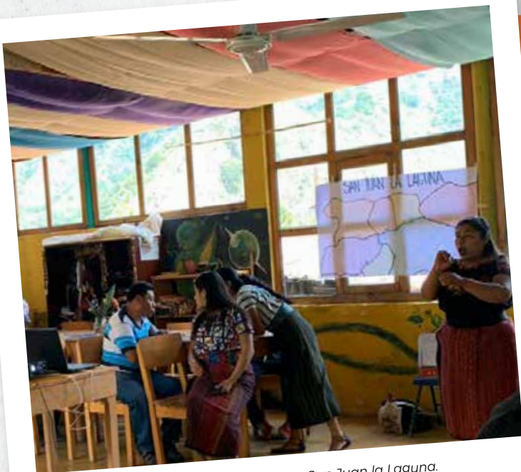
Participantes de taller en gobernanza en San Juan la Laguna.

El proyecto Somos Atitlán, gobernanza democrática para el desarrollo sostenible de las comunidades indígenas en la Cuenca del Lago de Atitlán, es financiado por la Unión Europea desde enero de 2018 y es ejecutado por Movimiento África'70 y sus socios: Amigos del Lago de Atitlán, Universidad del Valle de Guatemala (UVG), ADECCAP (Asociación de Desarrollo Comunitario del Cantón Panabaj) y Legambiente.