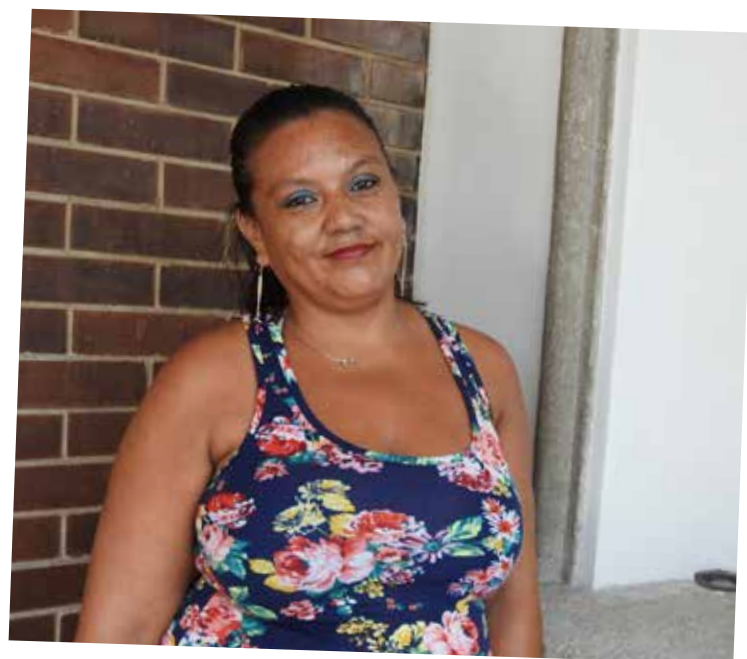
Gloria participante de “Las Escuelas de papás, mamás y familia ampliada”.

Desde su inicio en septiembre de 2018, la Unión Europea y la Agencia Española de Cooperación Internacional para el Desarrollo financian el Programa Prevención de la Violencia y el Delito contra Mujeres, Niñez y Adolescencia. Esta iniciativa es implementada por la Secretaría Ejecutiva de la Instancia Coordinadora de Modernización del Sector Justicia, SEICMSJ, y el Centro de Acción Legal para los Derechos Humanos, CALDH. Opera en los departamentos de Escuintla, Retalhuleu y Suchitepéquez.