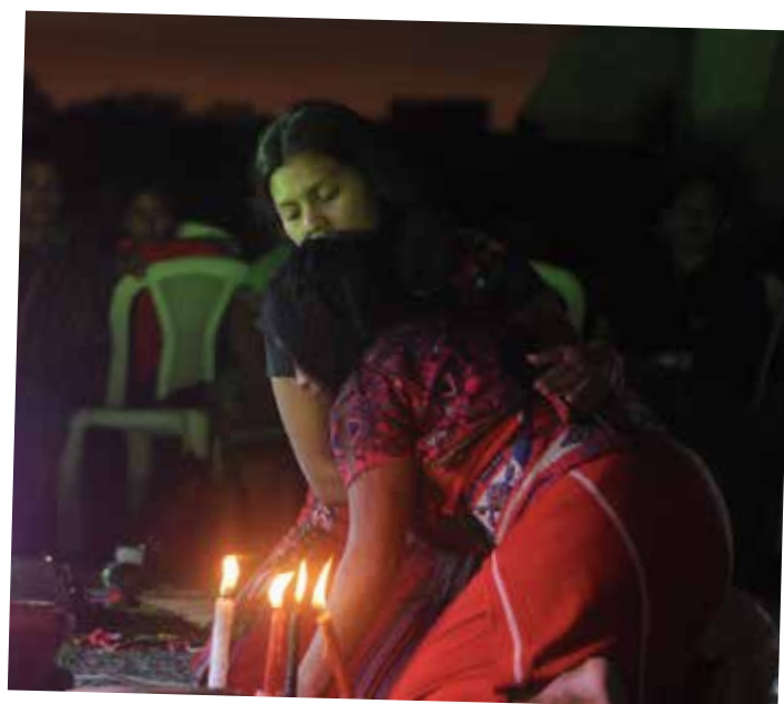
Mujeres participando en el IV Festival por la Memoria, la Voz y la Libertad de las Mujeres.

La Cooperación de la Unión Europea financia el Proyecto “Tejiendo redes de mujeres mayas y mestizas, líderes sobrevivientes de violencia para ejercer sus derechos con libertad, justicia y equidad”, que se desarrolla desde hace siete años en varias comunidades de los departamentos de Huehuetenango, Quiché, Chimaltenango y Petén. Este programa lo ejecutan las organizaciones de mujeres: Actoras de Cambio, Voz de la Resistencia y la Defensoría de la Mujer Ix, acompañadas por el Comité Catholique contre la Faim et pour le Développement - Terre Solidaireres.