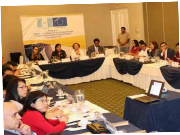
Segunda reunión anual del Comité de Dirección del Programa MIPYMES y Cooperativas.