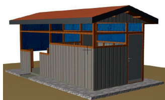
Zone de tri des malades

Le plan des zones de tri des malades et des salles d'attente est fait, ainsi que le planning d'exécution des travaux de construction.