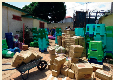
Matériel de riposte Covid19 à la délégation de Tdh à Conakry

Terre des hommes (Tdh) est la plus grande organisation suisse d'aide à l'enfance. En 2019, nos programmes en santé, protection et urgence sont venus en aide à plus de quatre millions d'enfants et membres de leurs communautés dans 38 pays.