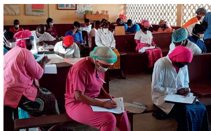
Formation en PCI Covid19 dans un centre de santé à Kindia